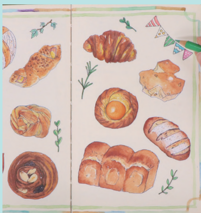
▲使用描画材 / サインペン・水彩絵の具・色鉛筆