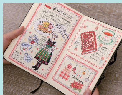
▲使用描画材 / サインペン・色鉛筆 左ページイラストは白い紙に描いてコラーージュ