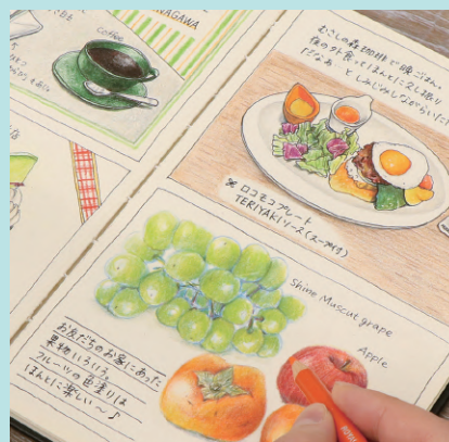
▲使用描画材 / 色鉛筆・サインペン