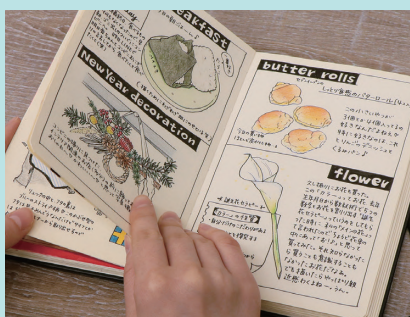
▲使用描画材 / マーカー・サインペン・色鉛筆